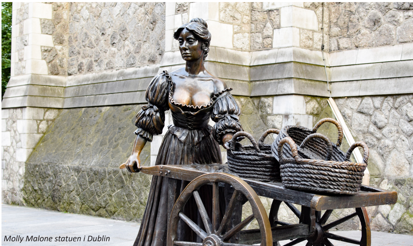
Molly Malone statuen i Dublin