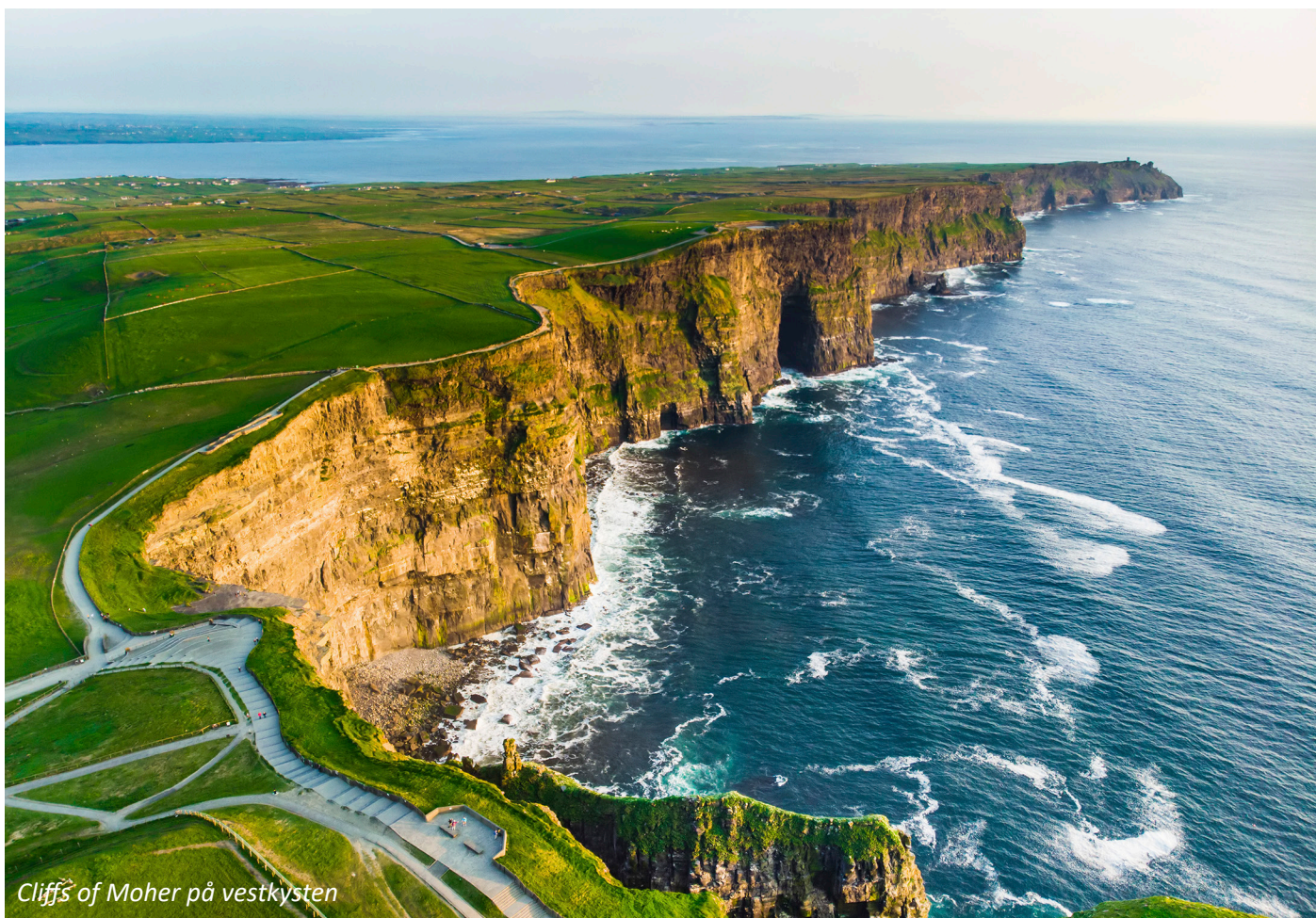
Cliffs of Moher på vestkysten

for sit livlige musikliv og mange musikfestivaler. Byen ligger ved Corrib floden, og i centrum finder man et livligt latinerkvarter og en smuk havpromenade. Der er tidligere drevet handel med den Iberiske halvø, og der findes eksempler på spansk arkitektur i byen.