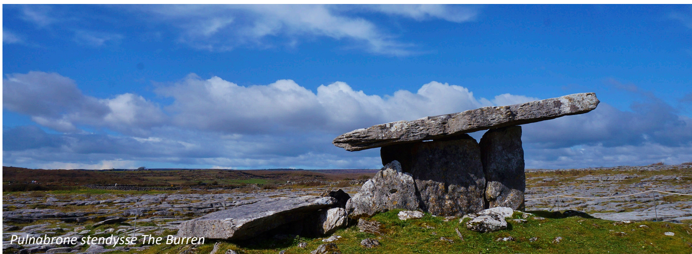
Pulnabrone stendysse The Burren